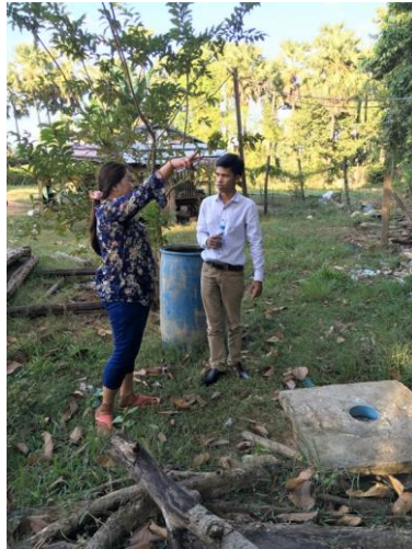
សហគ្រិនជាស្ត្រីពន្យល់អំពីទីតាំងប្រភពទឹកដែលទទួលទឹកមកសម្រាប់សហគ្រាសទឹកស្អាតរបស់គាត់។