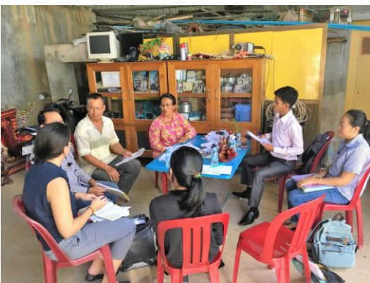
រូបភាពទី១. សមាជិកក្រុមស្រាវជ្រាវបានធ្វើសម្ភាសន៍សហគ្រិនផ្គត់ផ្គង់ទឹកស្អាតចំនួន១៥សហគ្រិនជាស្ត្រី នៅក្នុងប្រទេសកម្ពុជា (នេះជារូបភាព១ ក្នុងចំណោមការធ្វើសម្ភាសន៍)

គោលបំណងនៃការស្រាវជ្រាវនេះ គឺដើម្បីជម្រាបជូន និងគាំទ្រដល់អង្គការមិនមែនរដ្ឋាភិបាល អ្នកផ្តល់ ជំនួយ និងស្ថាប័នរាជរដ្ឋាភិបាលកម្ពុជា ដើម្បីអភិវឌ្ឍន៍បរិស្ថានដែលអំណោយផល (ដូចជាការកសាង សមត្ថភាព) ដែលមើលឃើញយេនឌ័រ អាចគាំទ្រការផ្តល់អំណាចដល់ស្ត្រី និងនឹងផ្តល់វិភាគទានដល់សេវាផ្គត់ ផ្គង់ទឹកស្អាតប្រកបដោយចេរភាព នៅតំបន់ជនបទ។ សំណួរទាំងឡាយដែលពាក់ព័ន្ធនឹងការស្រាវជ្រាវនេះ គឺ ស្ថិតនៅក្នុងប្រអប់ទី១។