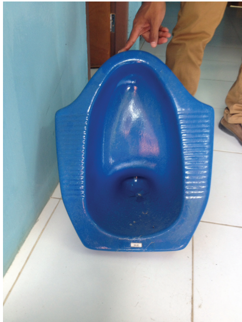
ONG lokál prodúz tiha sanita sentina lokalmente