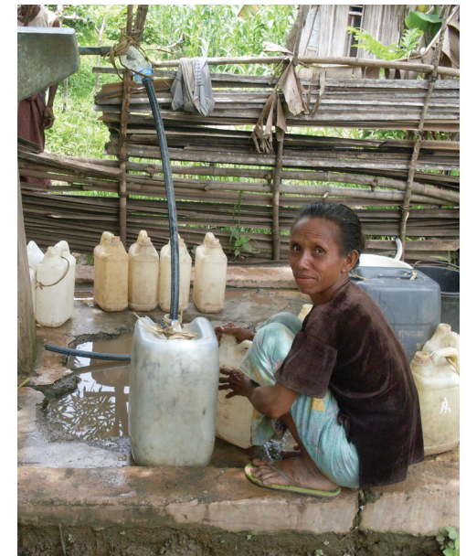
Manutensaun ne'ebé di'ak, fursionamentu sistema bee