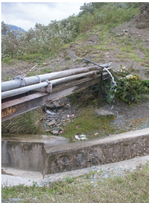
Sistema bee ne'ebé presiza manutensaun

Rezumu ida ne'e prezenta informasaun xave mak hetan husi peskiza kona-ba motivadóres, karakterístiku no dezafiu sira mak hasoru husi Empreza eskalaun ki'ik iha Timor-Leste no mós oportunidade no obstákulu sira hodi habelar sira nia knaar.