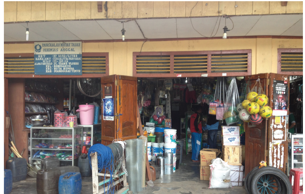
Makfa'an-rahun material konstrusaun baze distritu

oioun en relasaun ho sistema bee nian. Iha exesaun tolu maka kompañia espesializadu iha perfurasaun posu nian, kompañia rua maka fa'an pesa rahun sira no bomba sistema bee nian, no oferese servisu sira instalasaun ba tanke armazenamentu bee no/ka bomba eléktriku nian. Entre kompañia sira ne'ebé maka entrevista tiha ne'e, kompañia ualu maka bazeadu iha Distritu, no neen maka kompañia nasional. Kompañia baze-distritu sira iha tendensia foin maka hahú (kompañia 5 maka ho idade tinan 5 ba kraik) no kompañia baze nasional nian barakliuhotu maka ho idade tinan 12 to'o 18. En jerál kompañia sira hotu relativamente ki'ik, no la iha kompañia