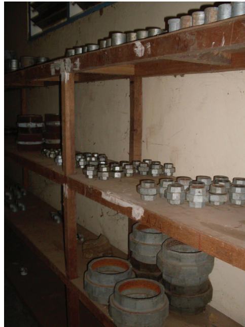
Kompañia ne'ebé maka fa'an sasán rahun pesa sira sistema bee nian

kompañia sira ne'ebé maka entrevista tiha ne'e barak liuhotu maka kompañia konstrusaun sira (11 husi 14) ho nivel péritu espesializadu